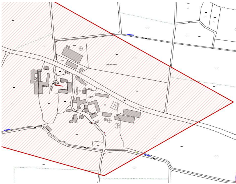
Karte 3: Detail Marzelstetten