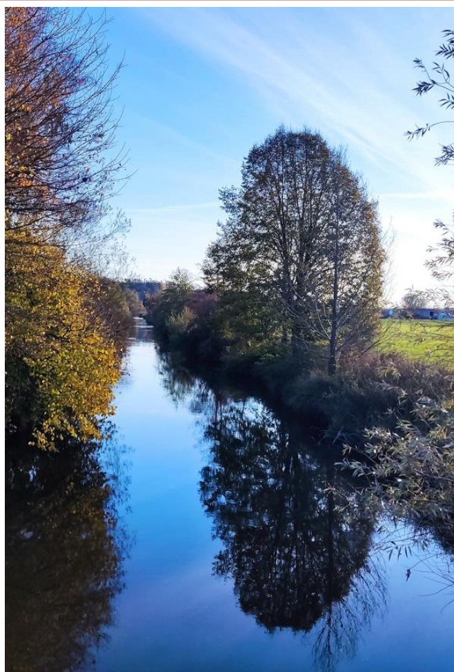
Aussicht von der Zusambrücke