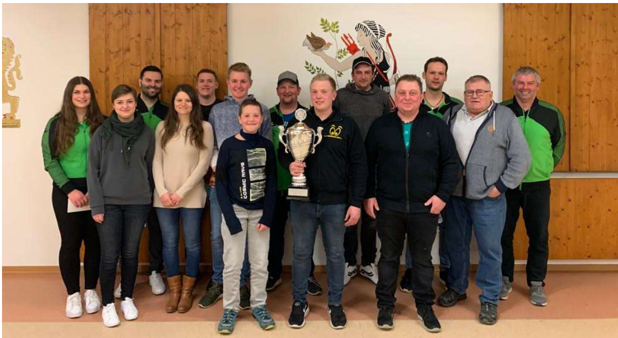
Berichte und Bild: Manfred Reuter

Am Ende bedankte sich 1. Vorstand Reuter Manfred noch bei seinem Team und den Sponsoren Getränkemarkt Demharter und Biohof Josef Ilg für die Bereitstellung zahlreicher Sachpreise und lud alle Vereine für die 20. Dorfvereinsmeisterschaft am 26. Februar 2023 ein.